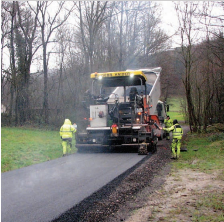
Asphaltierungsarbeiten in der hinteren Kaiserbrunn am 2. Dezember 2014