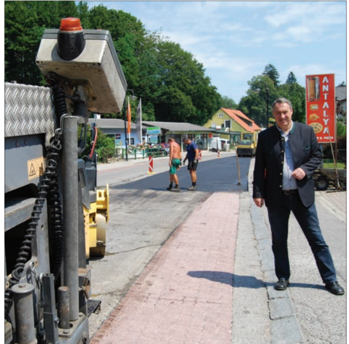
Asphaltierungsarbeiten in der Pressbaumer Hauptstraße