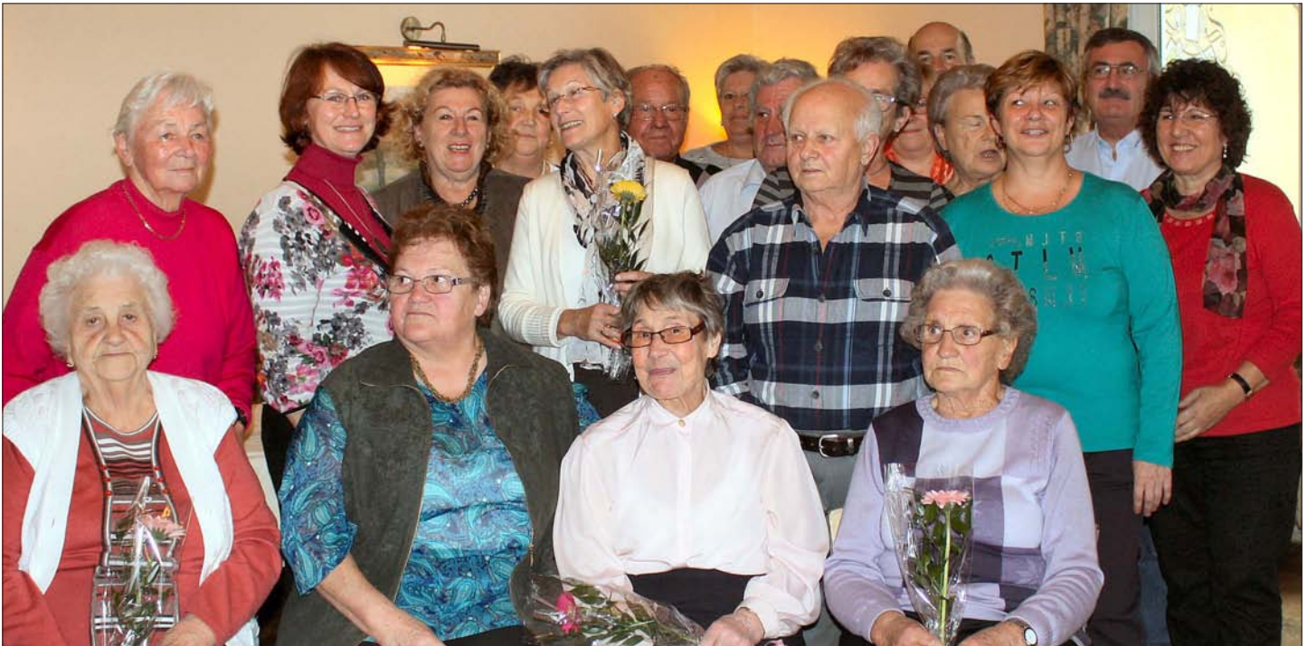
Die Oktober bis Dezember Geburtstagskinder, Mitglieder des Seniorenbundes Pressbaum Tullnerbach feierten ein fröhliches Geburtstagsfest am Strohziogl, bei Zithermusik