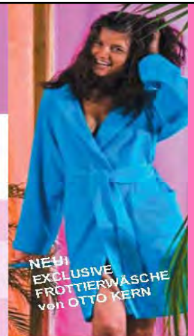
NEU! EXCLUSIVE FROTTEERWÄSCHE von OTTO KERN