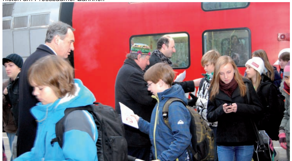
Bürgermeister Josef Schmidl-Haberleitner beim Verteilen der Informations-Folder an Schulpendinger des Sacré Coeurs.