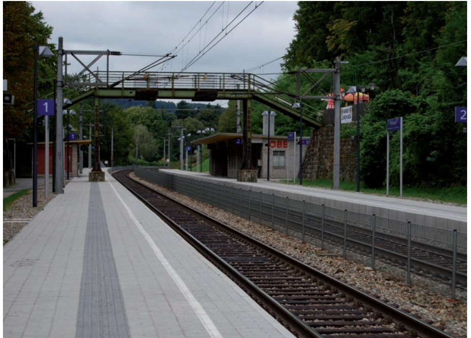
Nur mehr Geschichte: Die Brücke über die Westbahn beim Bahnhof Pressbaum.

Als Verbindung der beiden Bahnsteige des Bahnhofes Pressbaum ist derzeit die Fußgängerunterführung an der Ostseite der Bahnsteige im Bau. Damit wird endlich eine barrierefreie Querung der Gleise möglich. Von der Gemeinde Pressbaum wurde im Zuge dieser Umbauten der dringende Wunsch an die ÖBB um Belassung der „alten“ Eisenbrücke geäußert, da sie für viele Leute die praktischste Verbindung zur anderen Bahnseite bildete. Die Gemeinde Pressbaum erklärte sich sogar bereit, zukünftig sowohl für die Erhaltung, als auch für Wartung und (Winter-)Betreuung dieser Brücke zu sorgen. Ein Angebot, das von den ÖBB abgelehnt wurde. Als Argument wurde genannt, dass aus technischen Gründen eine komplette Neuerrichtung der Brücke notwendig wäre, die aber ungefähr doppelt so viel wie der neue Durchgang kostete.