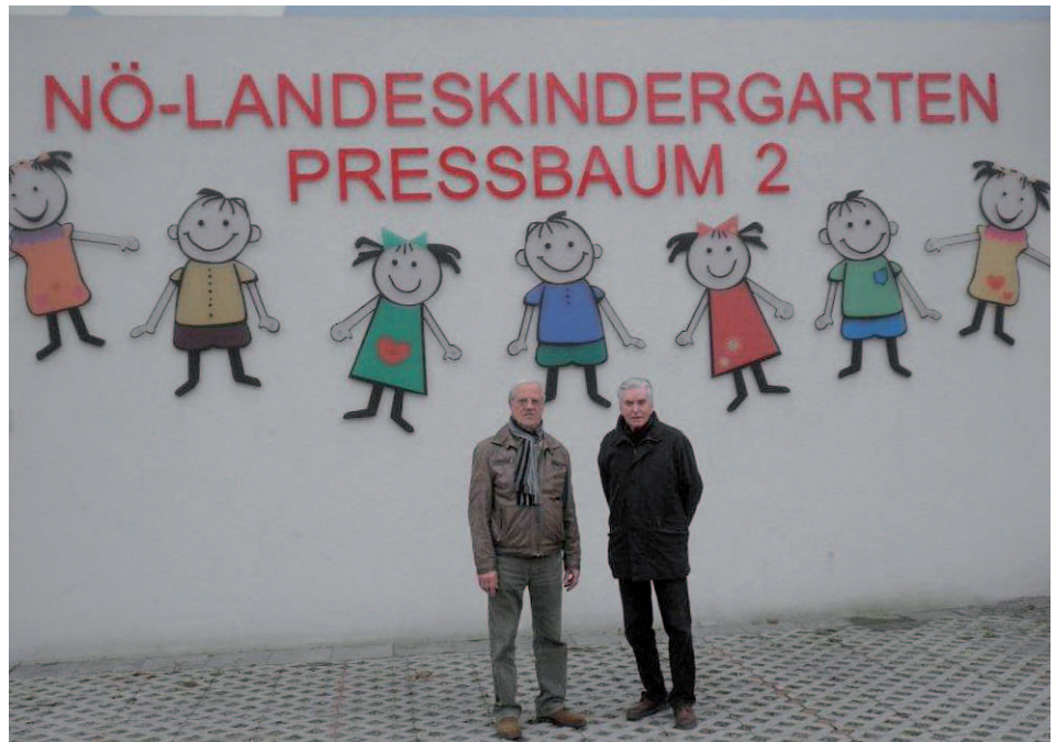
Zur Verschönerung der Ansicht vor dem Kindergarten 2, hat der Verschönerungsverein im August dieses Jahres Sträucher, statt dem Grünstreifen neben dem Gehweg gesetzt

Die Ruhebänke in Rekawinkel beim Biotop und am Hagen wurden in Zusammenarbeit mit der Dorfgemeinschaft