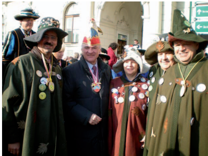
Die Pressbaumer Faschingsgilde beim Narrenwecken in Laa an der Thaya mit Landeshauptmann Dr. Erwin Pröll.