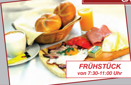
FRÜHSTÜCK von 7:30-11:00 Uhr

CAFE - RESTAURANT - PUB - SCHATTIGER GARTEN