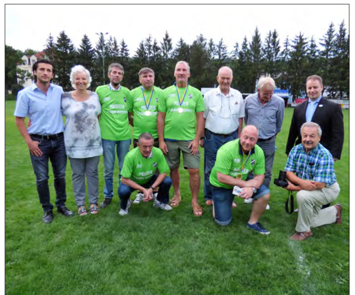
Meisterfeier der Funktionäre