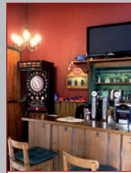
Pub mit Dartautomat

Montag bis Freitag 2 Mittagsmenüs von 11:00 - 14:00 Uhr