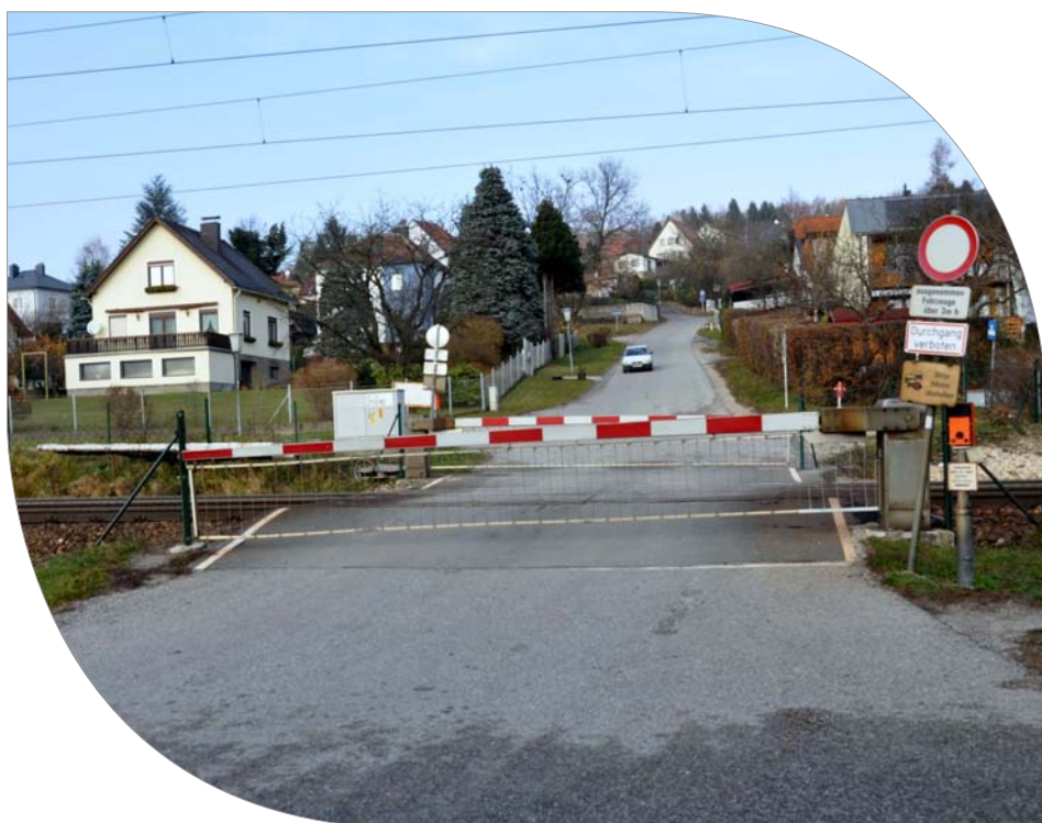
GR DI Erik Kieseberg

Im Gemeinderat stimmten die Vertreter aller Oppositionsparteien ge-