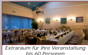
Extraraum für ihre Veranstaltung bis 60 Personen