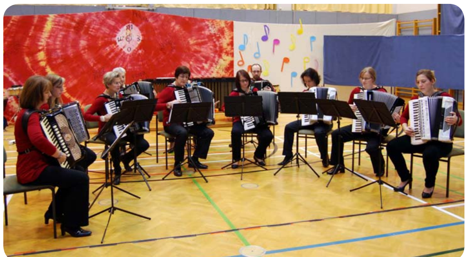
Eröffnung durch die „Swinging Accordians“