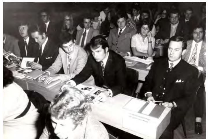
Vorne rechts Vertreter der Christlichen Gewerkschafter beim ÖGB Kongress 1970