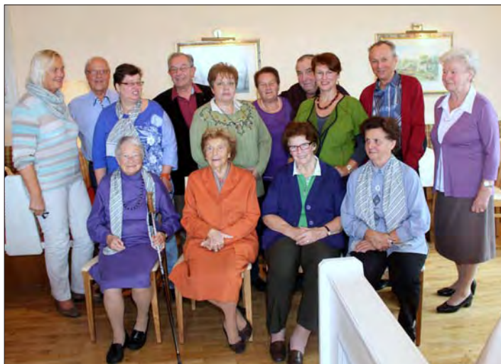
Seniorenbund Geburtstagsfeier aller Juli, August, September Geborenen.