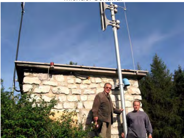
Bei der Inbetriebnahme der Sirene im Schwabendörfel