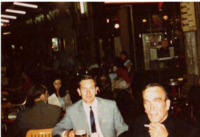
Christlicher Gewerkschaftsvertreter bei der internationalen Arbeitsorganisation in Genf 1971