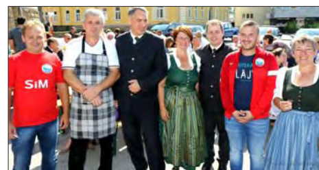
Integrationsverein SIM beim Dirndlgedwandsontag