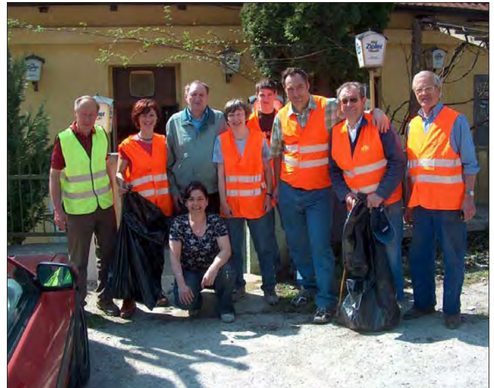
Bei der Müllsammelaktion 2006