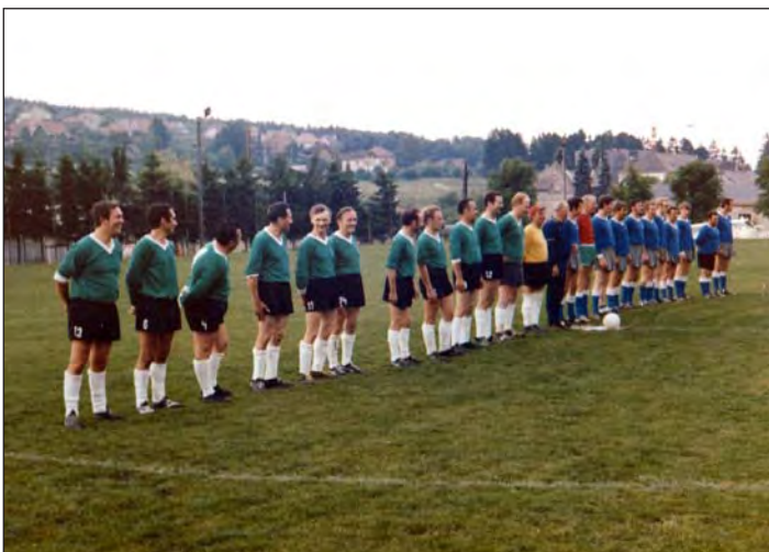
Erster von links in der Fussballmannschaft des Gemeinderates 1970