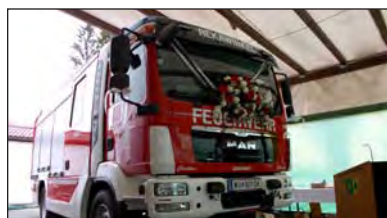
HLF2 FF Rekawinkel

FEUERWEHR leistete sowohl in Rekawinkel als auch in Pressbaum zahllose Stunden im Dienste der Allgemeinheit und Gefahrenabwehr. Wichtig ist dafür eine gute Ausrüstung, wobei mit Gemeindemitteln heuer einerseits ein neues HLF 2 in Rekawinkel in den Dienst übernommen sowie ein neues Mannschaftstransport-Fahrzeug für die Feuerwehr Pressbaum bestellt wurde. Für weitere Anschaffungen 2016 und 2017 gibt es schon Vorgespräche, wobei auch nach der Kommandantenwahl im Jänner 2016 die gute Zusammenarbeit fortgesetzt wird.